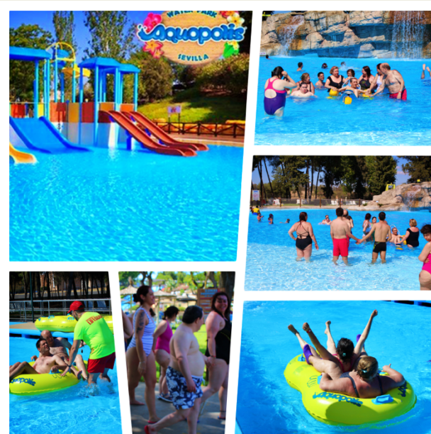
Nuestros residentes visitan el Acuópolis Sevilla