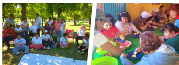
Salidas realizadas en el último trimestre